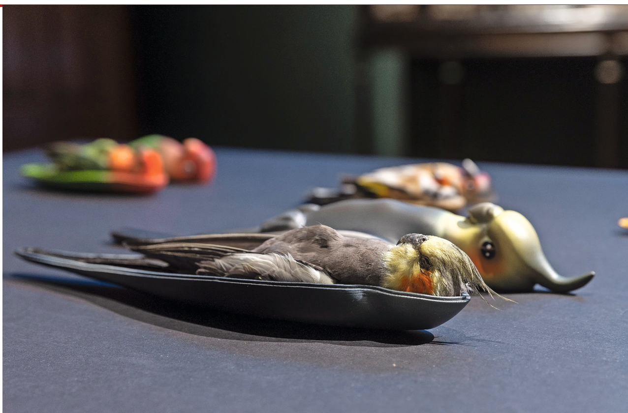
Charles Degeyter, The Aviary (detail) , 2022. © David Samyn

heid. De kei zal de mensheid immers overleven. Een verrassend spel met tijd en vergankelijkheid.